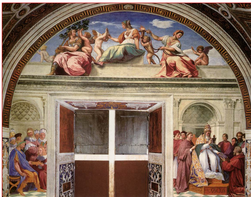
Raffaello: A JOGTUDOMÁNY FALA